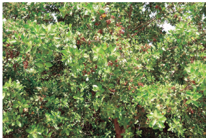
Foto 3. Mangle negro - Mangle salado.