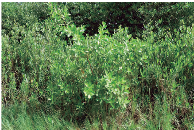
Foto 2. Mangle rojo.