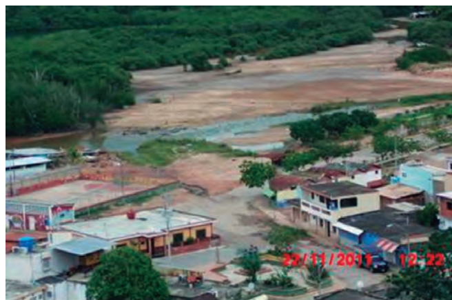
Foto 1. Vista panorámica del área de estudio, La Sabaneta, Mochima, estado Sucre, Venezuela.

La comunidad de Mochima está ubicada en Venezuela, estado Sucre, municipio Sucre, parroquia Ayacucho. Limita por el Norte: la Bahía de Mochima, por el Sur: la autopista Cumaná - Puerto la Cruz, por el Este: el sector la Hacienda y por el Oeste: el Cementerio de la misma comunidad. Dentro de sus linderos se encuentra el área específica de estudio que es la zona de manglar del sector la Sabaneta de la comunidad de Mochima, la cual limita por el Norte: con la Bahía de Mochima, por el Sur: la entrada principal de la comunidad, por el Este: el sector la Hacienda y por el Oeste: Quebrada el Alambique. Foto 1.