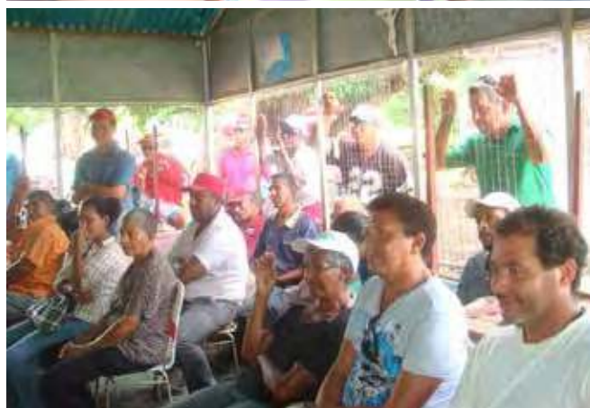
Encuentro Formativo de proyectos en la Comunidad Las Flores, municipio Simón Rodríguez, estado Anzoátegui Agosto 2012.