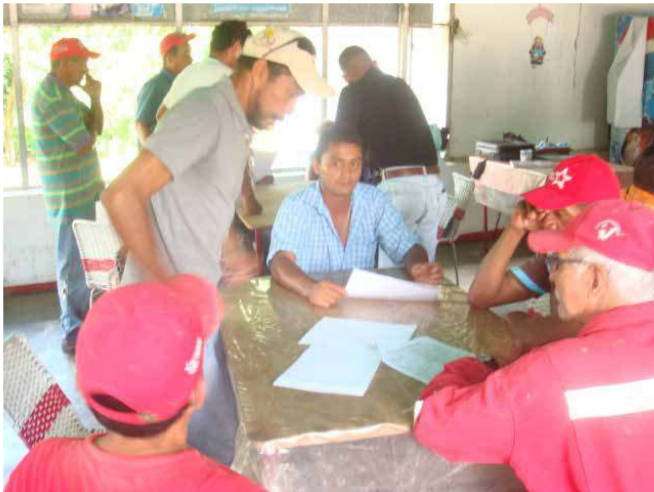
Mesas de trabajo en la elaboración de proyectos socio productivos comunidades rurales. Julio - Septiembre 2012.

En cada punto y círculo de los proyectos estratégicos quedaron organizados y formulados los proyectos socio productivos, los títulos se definieron de la siguiente manera: