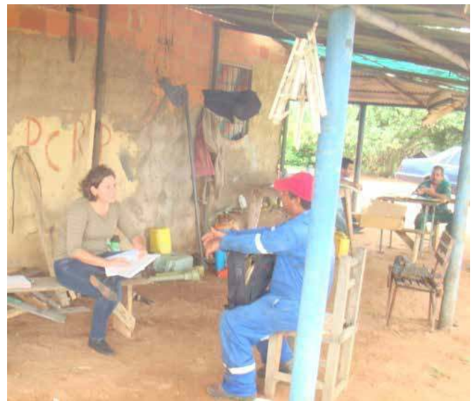
Promoción a la participación de los proyectos en comunidad Miga del municipio Simón Rodríguez.

Una de las principales características de la promoción es la capacidad de fomentar ambientes formativos/educativos populares, a través de la reflexión que se produce en cada encuentro y diálogo con la comunidad. Este proceso no solo considera la producción, sino que en primera instancia palpa los aspectos y hechos sociales que facilitan la organización, educación e investigación.