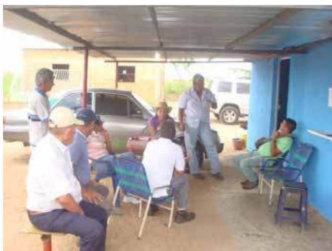
Promoción a la participación de los proyecto en comunidad Parcelamiento La Aventura del municipio Simón Rodríguez

En la promoción del desarrollo de las actividades comunitarias en la zona sur de Anzoátegui, desde el 2012 se incorporó a las organizaciones (Consejos Comunales) de los puntos y círculos existentes alrededor de los proyectos estratégicos, a fin de reconocer y organizar la realidad adyacente, particularmente con la formulación de los proyectos socios productivos. Los mencionados proyectos estratégicos son: a) Centro Genético Florentino Paraíso con los Consejos Comunales de Las Flores, Altagracia del Cari y Las Piedras del Cari, municipio Simón Rodríguez; b) Planta de Beneficio de Semilla, con el Consejo Comunal Parcelamiento La Aventura del municipio Simón Rodríguez y c) Proyecto de Incremento de la producción de avícola con los Consejos Comunales La Concordia y Mata de Flores, del municipio Pedro María Freites.